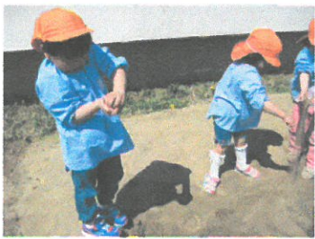
『砂遊びって 面白い』