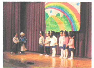
『ちょっとときどき 発表会』