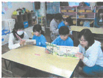
『お家の人と 絵本タイム』