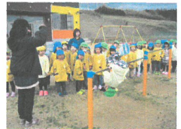
『約束守って 遊ぼうね』